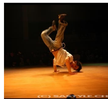
Break dance battle

Hip Hop on tour avec Black Tiger.