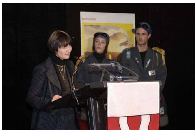
Madame la Conseillère Micheline Calmy-Rey lors de la clôture de swixx à Renens.