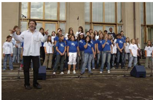
Renens Capitale Culturelle: chœur des Enfants de la Source.