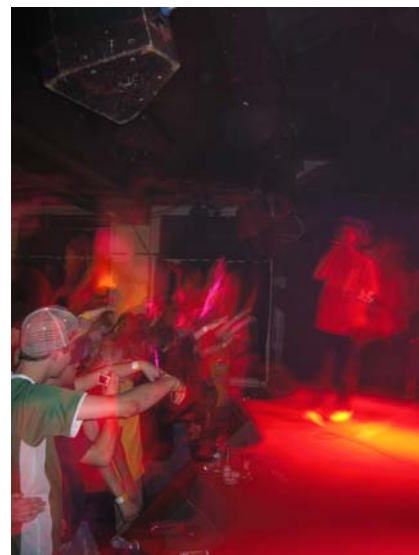
Hip Hop on tour.