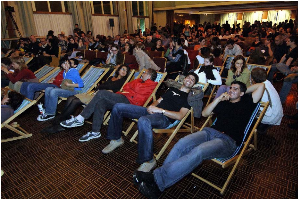
Renens Capitale Culturelle: nuit du cinéma.

Lancé à l'automne 2004 par une série de concerts, swixx a primé une quinzaine de créateurs dans le cadre d'un concours, mis en place des fenêtres dans le cadre de festivals, offert des nuits du Hip Hop, proposé des publications, pour se clore en octobre à Renens, promue capitale culturelle le temps d'un week-end. Renens a été la Capitale Culturelle de la Suisse pendant 30 heures : 7000 visiteurs venus de toute la Suisse ont participé les 20 et 21 octobre 2006 à la fête de clôture du programme swixx - Mondes culturels suisses de la Fondation suisse pour la culture Pro Helvetia. Plus de 50 concerts, performances et spectacles gratuits ont été proposés en continu. La conseillère fédérale Micheline Calmy-Rey a fait l'honneur à Renens d'ouvrir la manifestation. La programmation artistique, audacieuse et variée, a permis de toucher un large public.