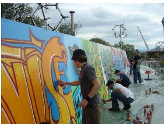
Workshop Hip Hop on tour, Bâle.