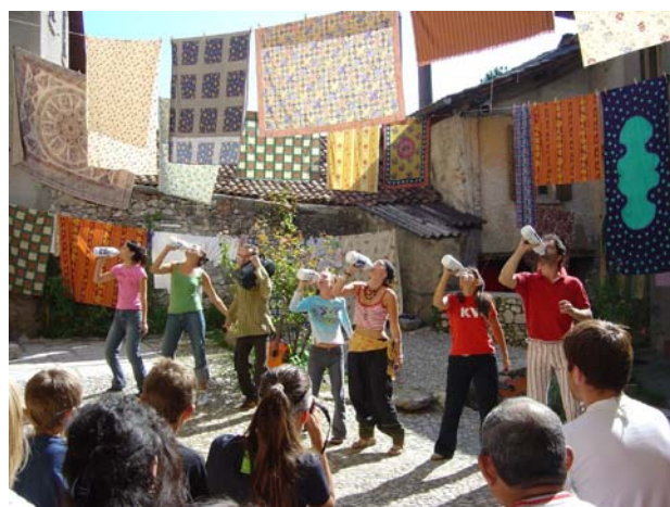
Festival di narrazione, Arzo.